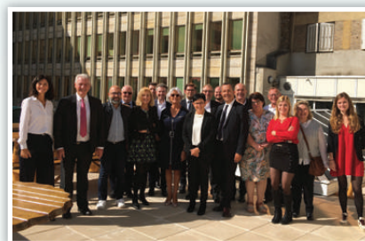
Conseil d'Administration de l'ANETT du 5 octobre chez Hellio

véritable enjeu dans les bâtiments de grande hauteur, Hellio assure ainsi la mise en place de destratificateurs et la gestion administrative du dossier de financement. La prime est directement déduite du devis pour moins d'avance de trésorerie avec à la clé : une réduction des déperditions thermiques, une baisse des émissions de CO 2 et une amélioration du confort des occupants.