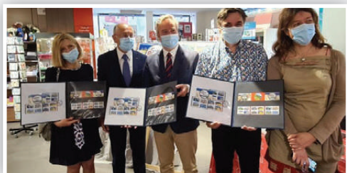
Présentation du carnet de timbres touristiques «France de Terre de Tourisme»